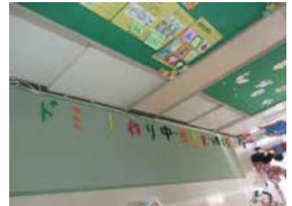
ドミノ作り中 （わくわく東十条ひろば）

【※1】延長利用は19:00まで可能です。 【※2】学童クラブ特例利用児童は下校せずお弁当を食べます。