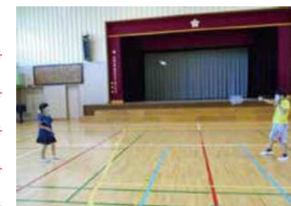
体育館遊び （わくわく堀船ひろば）