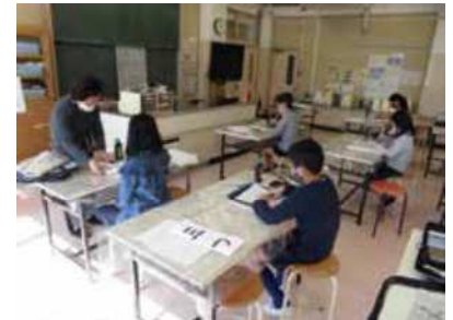
わくわく習字 （わくわく神谷ひろば）