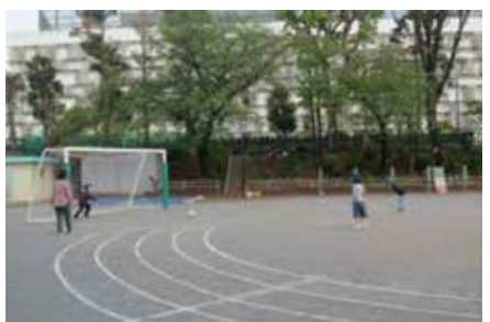
外あそび （わくわく八幡ひろば）