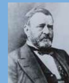
グラント將軍 (元第18代米國大統領)