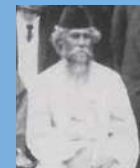
タゴール (インド詩人・ ノーベル文学賞受賞者)

渋沢翁は日本の近代経済社会の発展に尽力していく中で、王子・滝野川地域への助言や寄付なども行い、地域の発展を大事にしました。