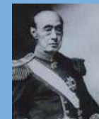
徳川慶喜 (江戸幕府第15代将軍)