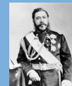
カラカウア王 (ハワイ王国第7代国王)