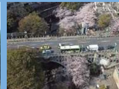
音無橋（音無親水公園）

渋沢翁が設立した日本煉瓦製造会社のレンガで作られ、酒類の醸造試験、酒類醸造講習の実習工場として利用されました。国指定重要文化財。大河ドラマ「青天を衝け」後半メインビジュアルの撮影地。