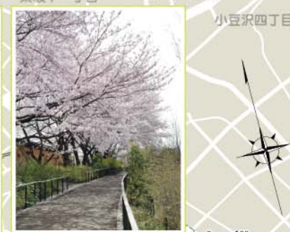
12 赤羽自然観察公園 赤羽西5-2-34