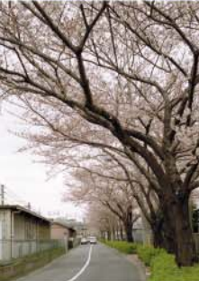
25 尾久・田端操車場 上中里2丁目付近