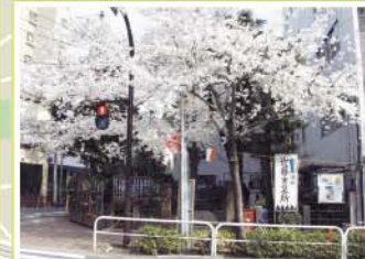
27 近藤勇と新選組隊士供養塔 滝野川7-8-10