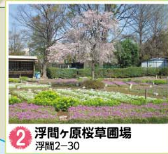
2 浮間ヶ原桜草園場 浮間2-30