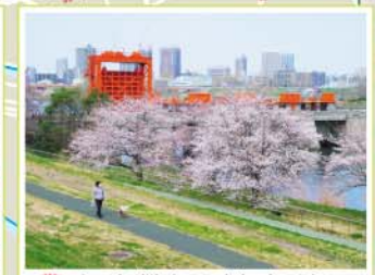
9 旧岩淵水門(赤水門) 志茂5-41地先