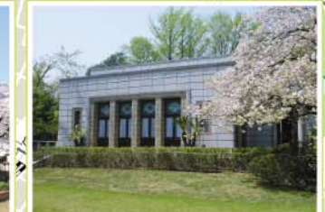
23 青淵文庫 西ヶ原2-16-1