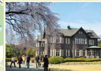
24 旧古河庭園 西ヶ原1-27-39