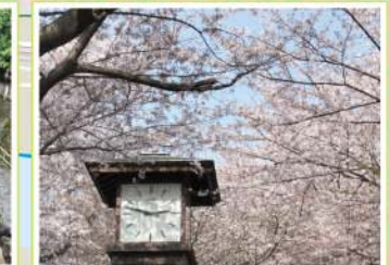
22 飛鳥山公園 王子1-1-3