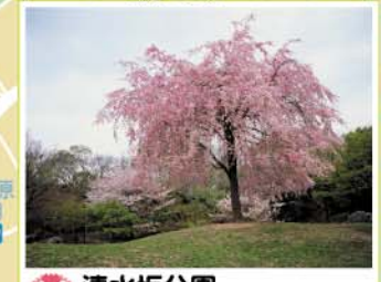
14 清水坂公園 十条仲原4-2-1