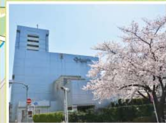
17 北とぴあ 王子1-11-1