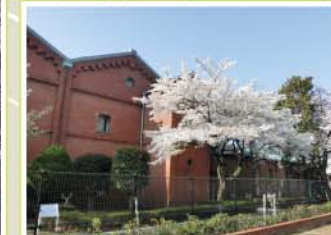
19 醸造試験所跡地公園 滝野川2-6-30