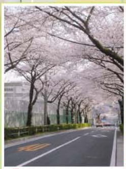
4 浮間中央通り 浮間5丁目付近