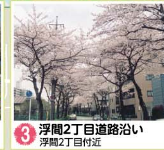
3 浮間2丁目道路沿い 浮間2丁目付近