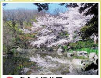
16 名主の滝公園 岸町1-15-25