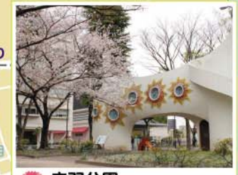
10 赤羽公園 赤羽南1-14-17