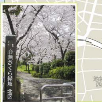
20 石神井川沿い 滝野川2丁目~5丁目