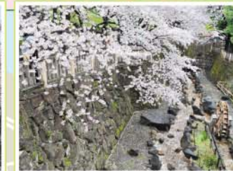
18 音無親水公園 王子本町1-1-1先