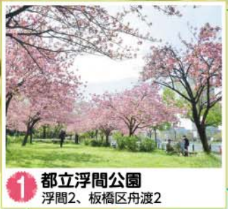
1 都立浮間公園 浮間2、板橋区舟渡2