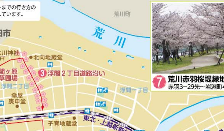
7 荒川赤羽桜堤緑地 赤羽3-29先~岩淵町41先