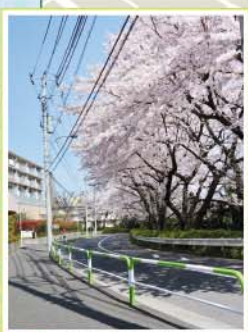
6 桐ヶ丘1丁目付近 桐ヶ丘1丁目