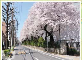
15 王子5丁目引込み線付近 東十条1丁目~3丁目、王子5丁目