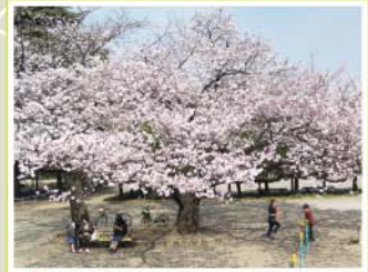
13 稲付西山公園 西が丘3-10-3