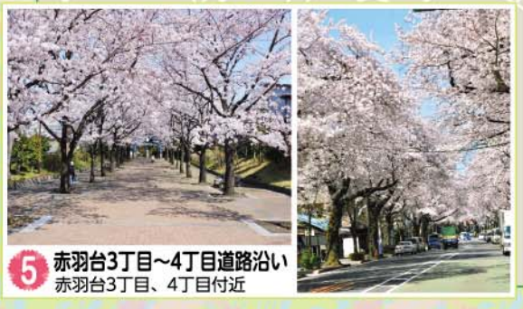
5 赤羽台3丁目~4丁目道路沿い 赤羽台3丁目、4丁目付近