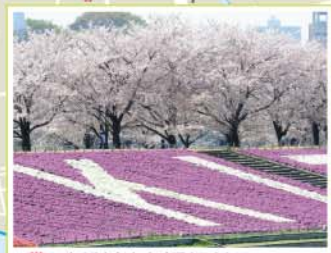
8 新荒川大橋緑地 赤羽3-29先