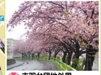
11 赤羽台団地外周 赤羽台1-4先、赤羽台2-1先