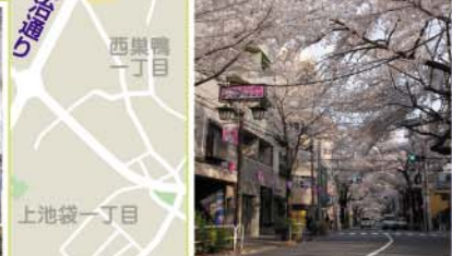
28 滝野川桜通り 滝野川7丁目付近