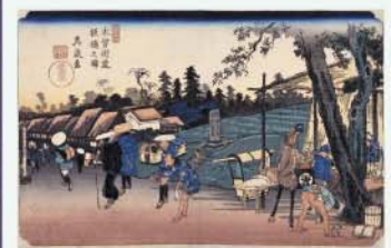
中山道1番宿:板橋宿 題名:木曾街道 板橋之驛 作者:深斎英泉 中山道広重美術館所蔵 この絵は現在のJR板橋駅付近です。

中山道と中仙道どちらが正しいのでしょうか。初めて中山道六十七次が定められた時は「山」と「仙」は特に統一されていませんでした。正徳6年(1716)、当時の学者・新井白石が道中奉行に、「東海道は海岸を通るから海道でよいが、中山道は東山道のうちの中筋の道であり、古来、東山道、山陰道、山陽道と読んでいるから、山の字である中山道を使用するように。」と命じたことの影響があり、公式に中山道と書くようになったと言われています。